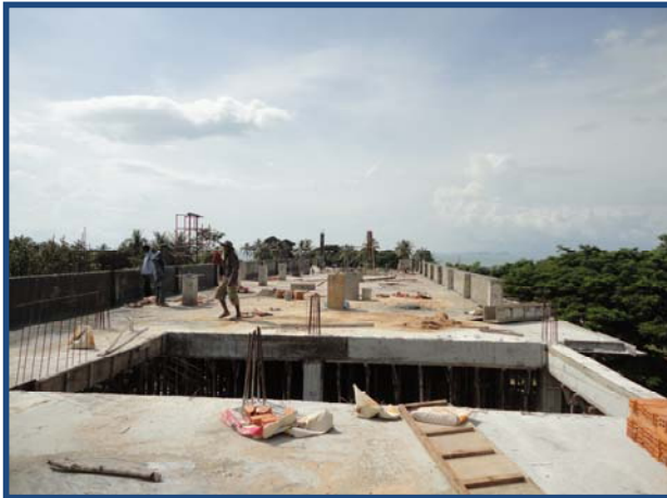
ការងារបេតុងកំរាល Concrete Floor Slab works