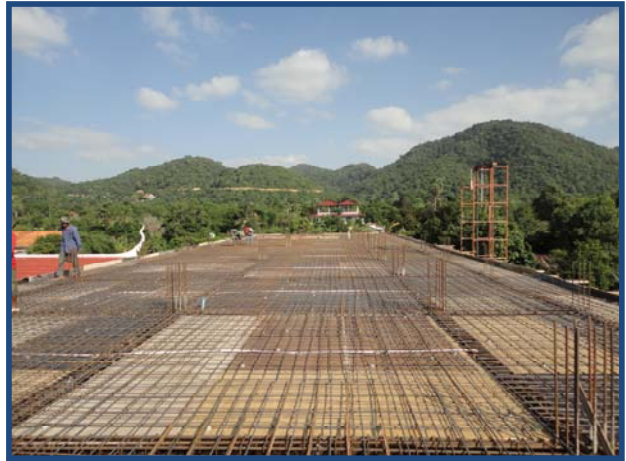
ការងារចងដែកឆ្នឹម និងកំរាល Steel Bar for Beam & Floor