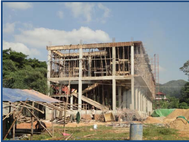
ការងារតម្លើងពង្រីក និងកំរាល Beam & Floor Form works