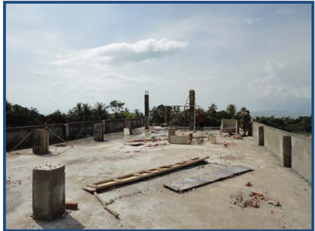
ការងារបេតុងសសរ Concrete Columns works